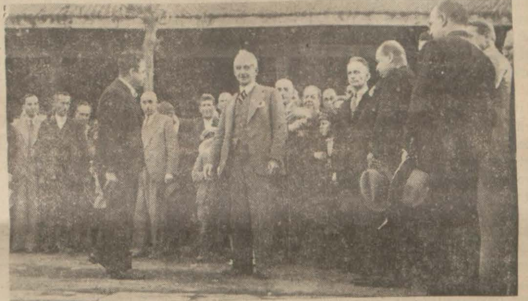
İsmet İnönü Aydın istasyonunda

İsmet İnönü, Ege mıntakasındaki tetkikleri sırasında yalnız zirai ve iktisadi işlerle uğraşmadı, çiftçinin her hali ve her derdi ile meşgul oldu, onu irşat etti