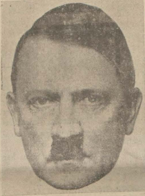
M. Hitler (Yazısı 3 üncü sayfada)